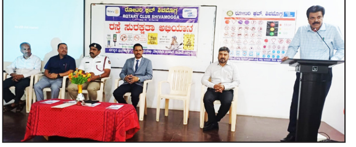
ದಿನಾಂಕ: 21-01-2026, ಬುಧವಾರದಂದು ರೋಟರಿ ಕ್ಲಬ್ ಶಿವಮೊಗ್ಗ ವತಿಯಿಂದ 'ರಸ್ತೆ ಸುರಕ್ಷತಾ ಸಪ್ತಾಹ ಮತ್ತು ಟ್ರಾಫಿಕ್ ರೋಲ್ಸ್' ಬಗ್ಗೆ ಕಾಲೇಜು ವಿದ್ಯಾರ್ಥಿಗಳಿಗೆ ಜಾಗೃತಿ ಮೂಡಿಸುವ ಕಾರ್ಯಕ್ರಮವನ್ನು ಹೆಚ್. ಎಸ್. ರುದ್ರಪ್ಪ ನ್ಯಾಷನಲ್ ಪಿ.ಯು. ಕಾಲೇಜಿನಲ್ಲಿ ನಡೆಸಲಾಯಿತು.